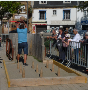
Challenge Kilhoù-Koz