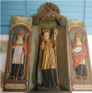
Niche à volets de St-Caradec, chapelle St-Guénolé

Dim 18, de 14h30 à 17h30, gratuit / Organisation : Musée de la Fraïse et du Patrimoine visites libres : sam 17, de 15h à 18h