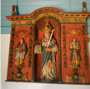
Niche à volets de St-Louis, chapelle St-Guénolé