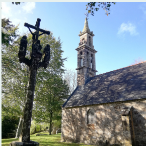
Chapelle Ste-Christine