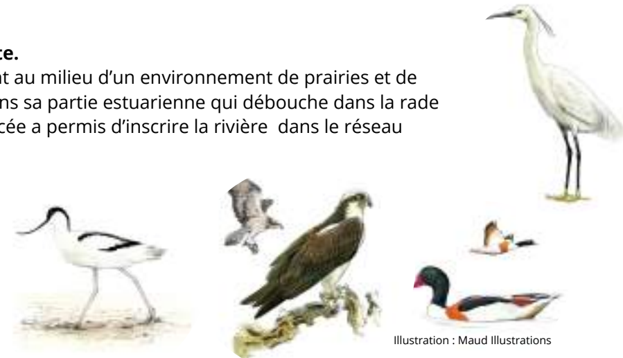
Illustration : Maud Illustrations