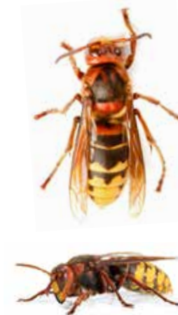
taille réelle 4 cm

Abdomen jaune clair rayé de noir. Tête jaune de face et rouge du dessus. Pattes rousses, thorax noir et brun-rouge.