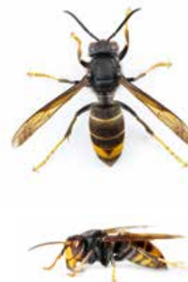
taille réelle 3 cm

Abdomen noir cerné de deux liserés jaune-orange et d'une bande jaune orange. Pattes jaunes aux extrémités. Thorax noir et tête orange vue de face.